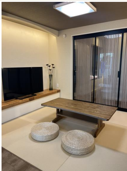
1階和室。木目が美しく成長サイクルが早い沖縄県産材のセンダンを棚板・座卓に使用