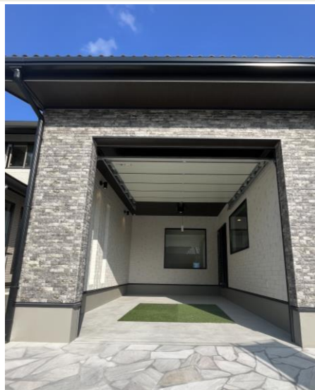
塩害によるさびから愛車を守り、天候の悪い日にも雨風にぬれず室内に入れるインナーガレージを設置