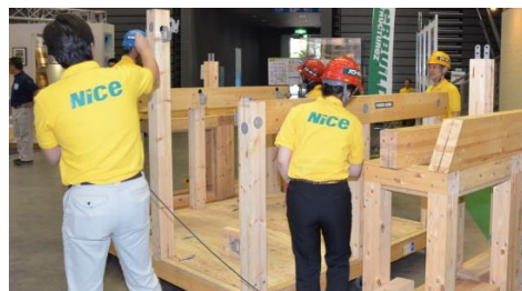
女性も参加する建築実演の様子