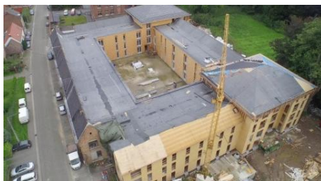
パワービルド工法を用いたベルギーの老人ホーム