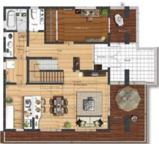
モデルハウス1階部分

屋根材には、「フランス瓦」をナイスホーム株式会社として初めて採用いたしました。これは台風や豪雨といった過酷な気象条件の沖縄県において採用されているもので、1枚1枚をビス止めしています。これにより、耐久性をさらに向上させたほか、デザイン性についても追求いたしました。