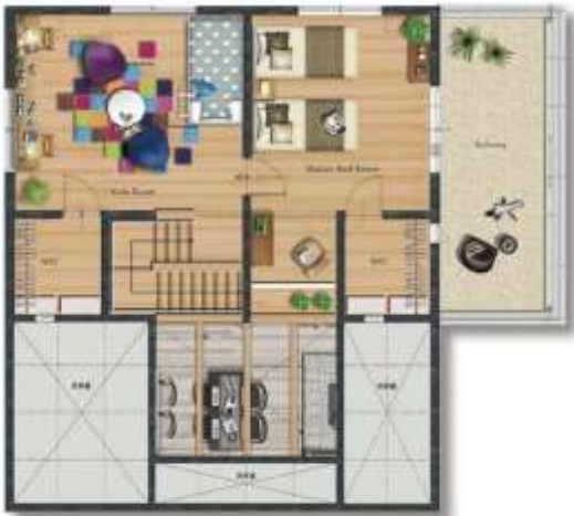
モデルハウス 2階部分